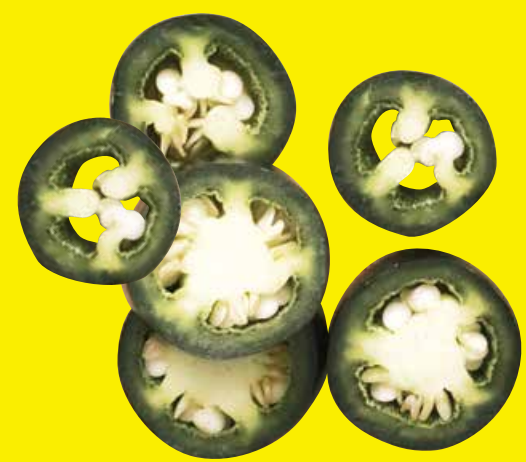
ハラペーニョピクルス +50