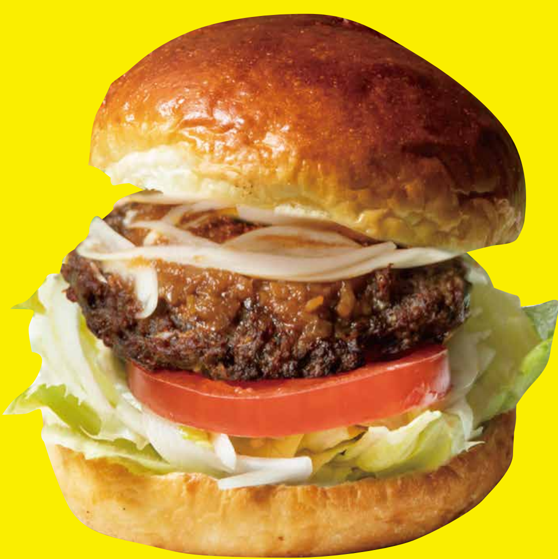
グッドモーニング バーガー 1100