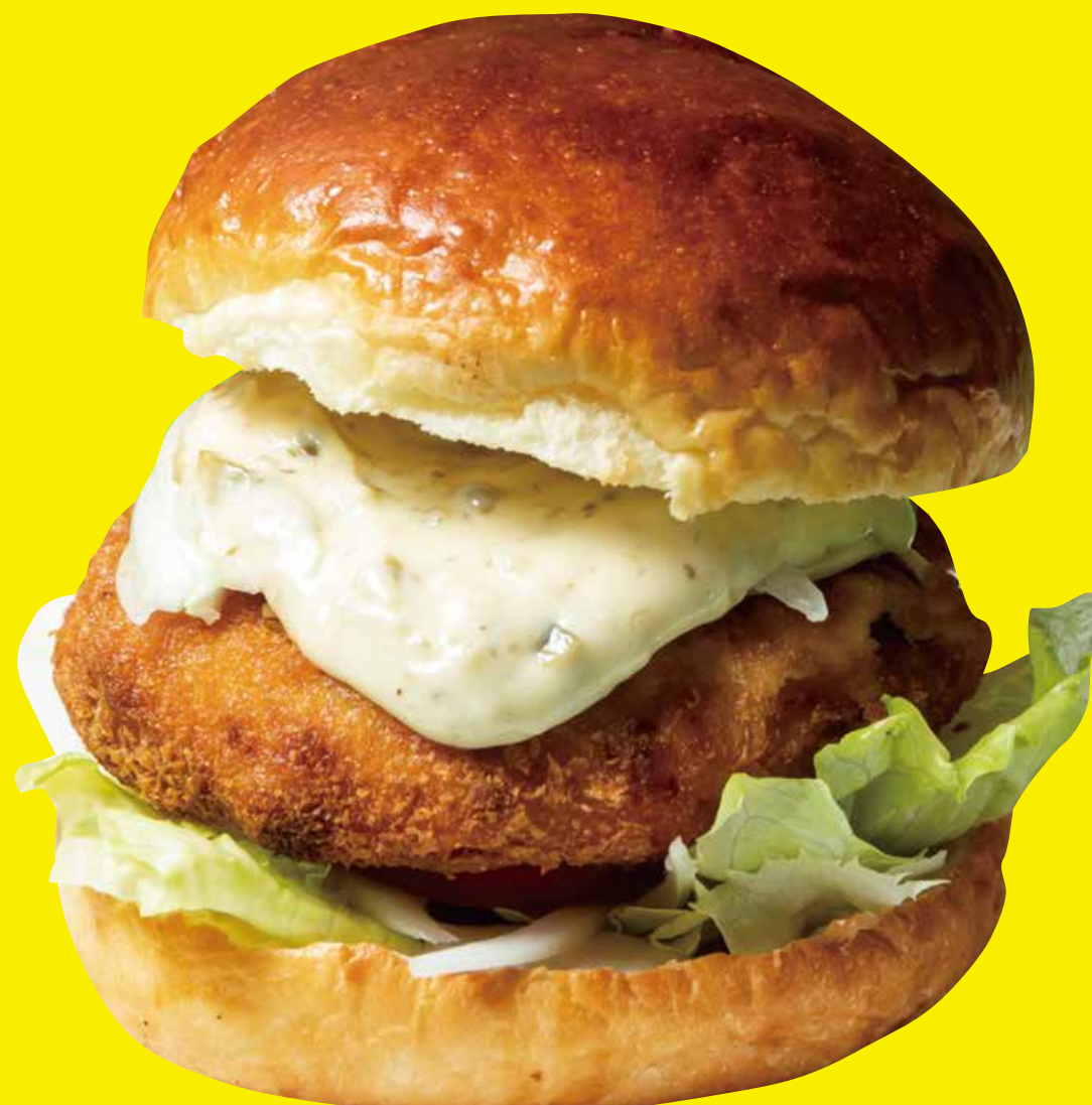
フィッシュバーガー 1200